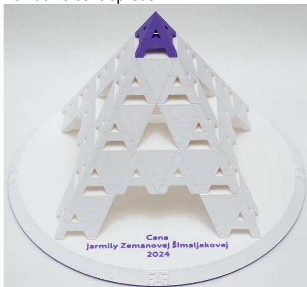
Pohľad na cenu spredu: