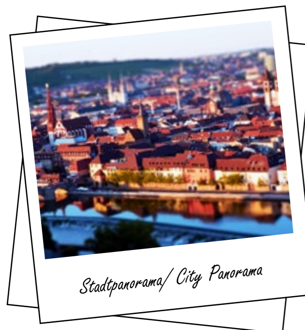
Stadtpanorama / City Panorama