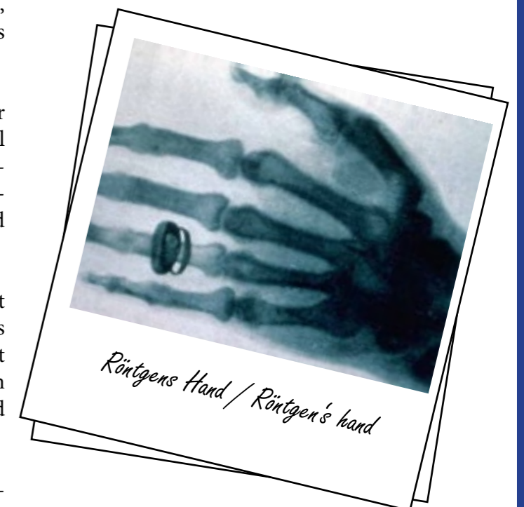
Röntgens Hand / Röntgen's hand

In the 19th century the University achieved international renown through the teaching and research of well-known scholars, in particular the philosophers Schelling and Brentano, the physician Virchow and the physicist Röntgen who received the first Nobel Prize for Physics in 1901. Seven other Nobel prize winners have come from Würzburg University, including the physicist Klaus von Klitzing and the chemist Hartmut Michel who were awarded the prize in the 1980s.